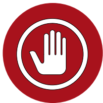
Protocolo de Prevención del Acoso