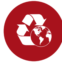
Medio Ambiente ISO 14001