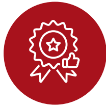
Calidad ISO 9001