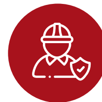
Seguridad Laboral ISO 45001