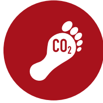
Huella de Carbono