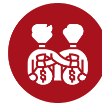
Compliance, Antisoborno y Canal de Denuncias