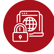
Ciberseguridad y Protección de Datos