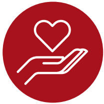
Responsabilidad Social Corporativa

En Ingertec contamos con una serie de servicios enfocados en desarrollar normativas imprescindibles a incluir en el código ético de cualquier tipo de organización: